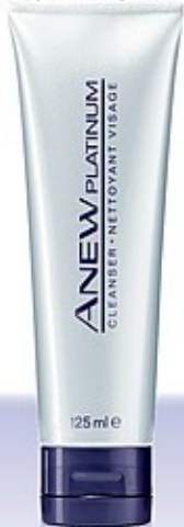
PLATINUM 60+ Limpiador 125 ml 172072 49,00€ 9,90€ Precio por 100ml 7,92€