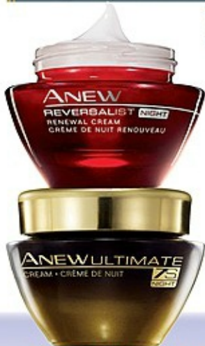
REVERSALIST 40+ la piel luce y se siente como nueva al instante** Crema de Noche Acción Reconstructora 50 ml 150026 64,00€ 24,50€ Precio por 100ml 49,00€

nuestra gama de cremas de noche a precios de locura. Ataja el anti-envejecimiento con ANEW