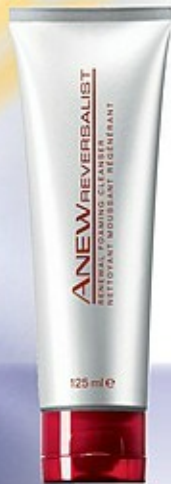
REVERSALIST 40+ Limpiador Espuma Efecto Reconstructor 125 ml 161281 49,00€ 9,90€ Precio por 100ml 7,92€

Anew combina la tecnología exclusiva anti-edad con las fórmulas de limpieza refrescantes, ¡no te las pierdas!