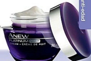
PLATINUM 60+ después de 2 semanas, se hace luz más joven*** Crema de Noche 50 ml 161943 40,00€ 27,00€ Precio por 100ml 54,00€

**Estado del Consumidor 09-173 de 8 semanas con 151 personas. ***Estado del Consumidor 08-207 de 8 semanas y 145 personas.