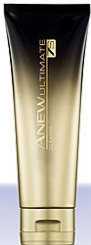
ULTIMATE 7S 50+ Limpiador 7S 125 ml 166066 49,00€ 9,90€ Precio por 100ml 7,92€